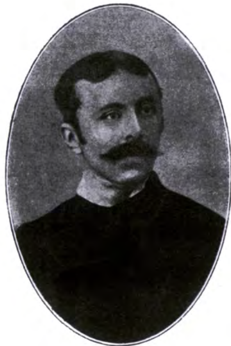
Edouard Ducéré (Bayona, 1849 - Bayona, 1910)