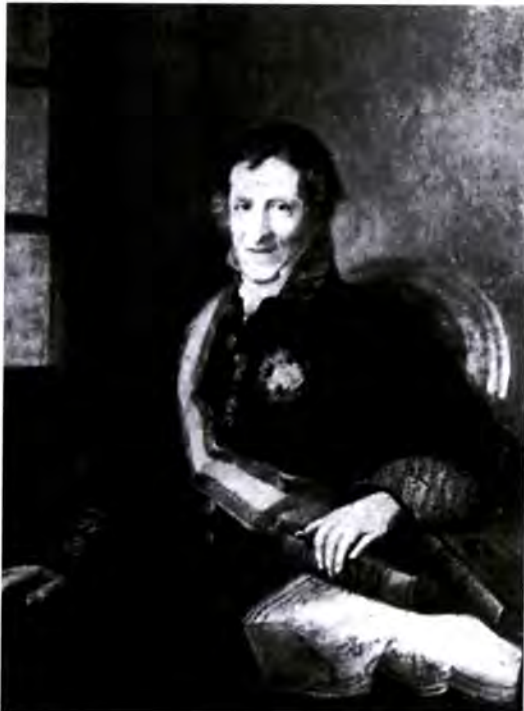
Martín Fernández de Navarrete (Abalos, Logroño, 1765 - Madrid, 1844)