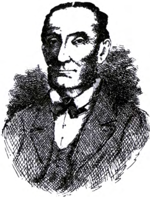
Pablo de Gorosabel (Tolosa, 1803 - Donostia, 1868)