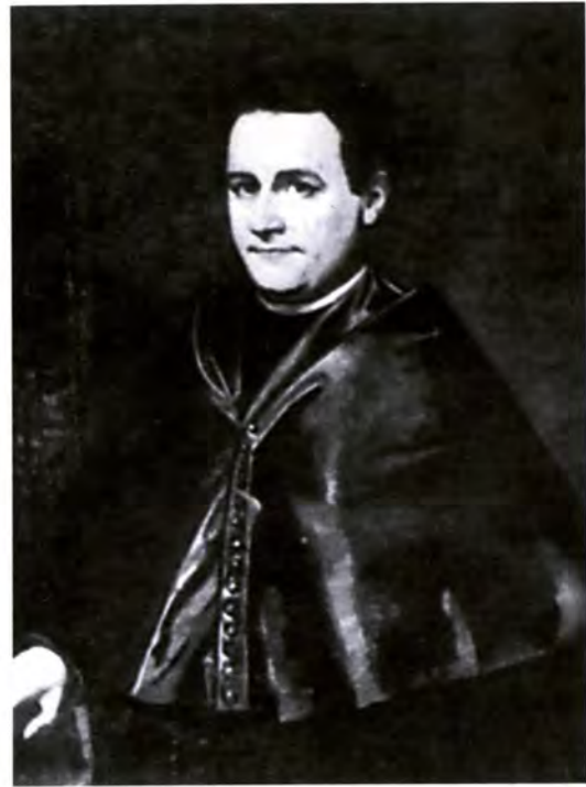
Estanislao Jaime de Labayru (Batanga, Filipinas, 1845 - Bilbao, 1904)