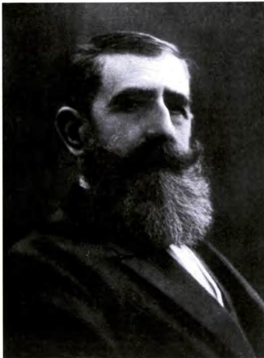
Ramón de Seoane y Ferrer (Madrid, 1858 - Madrid, 1928)