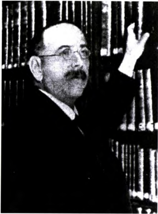
Teófilo Guiard y Larrauri (Bilbao, 1876 - Bilbao, 1946)