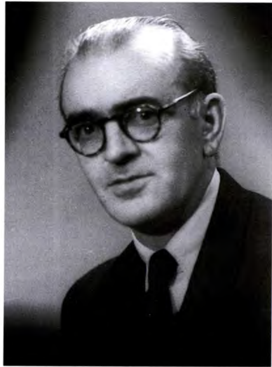
Mariano Ciriquiain-Gaiztarro (Beasain, 1898 - Donostia, 1964)