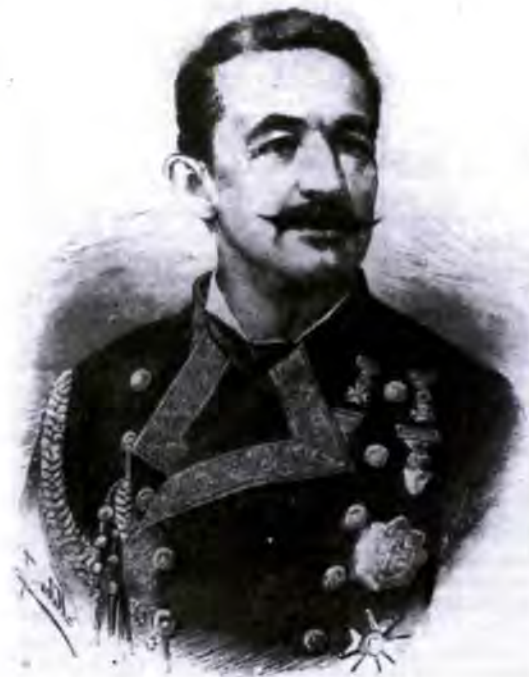
Cesáreo Fernández Duro (Zamora, 1830-1908)